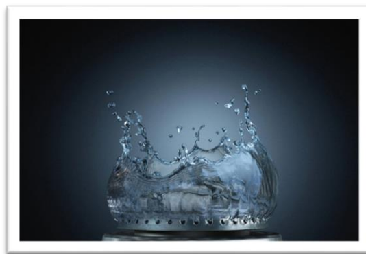
Alusiones al agua en trabajos de pintura, cómic, Street Art y fotografía digital. Mauricio Valencia, Proyecto A. Hydroman. Marvel Comics . Jeannie Hung. Pixelated water,