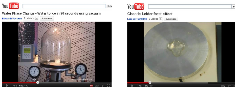
Figura 1: Algunos experimentos relacionados con el comportamiento fisicoquímico del agua