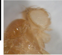
Identificación de fenotipo cepa white.