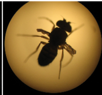
Identificación de fenotipo cepa vestigial (fotos: Catherine Urrutia e Ian Parra)